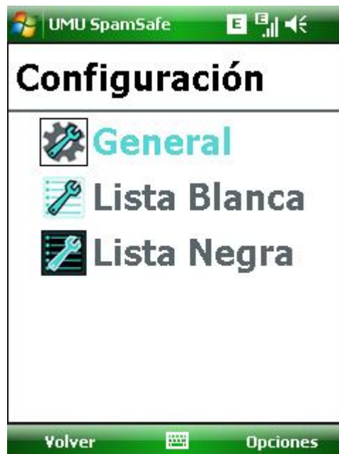
Figure 6 Configuración

Desde aquí, puede acceder a "General" para la configuración inicial y luego a la lista negra y la lista blanca para asignar directrices específicas.