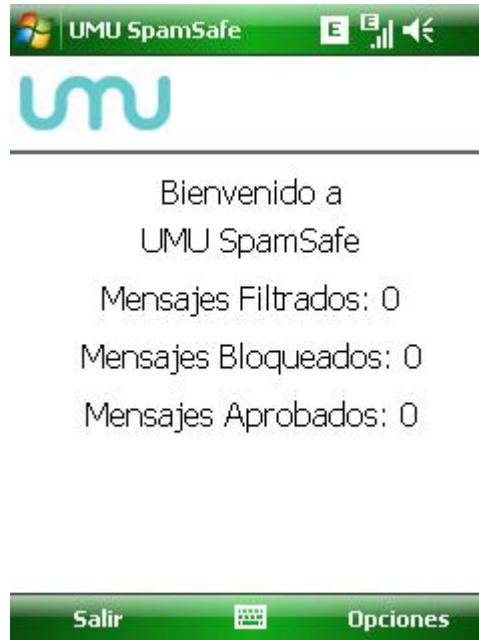
Figure 5 Pantalla Principal

La pantalla principal muestra el número de mensajes que han sido filtrados o bloqueados por UMU SpamSafe. Inicialmente estos serán cero.