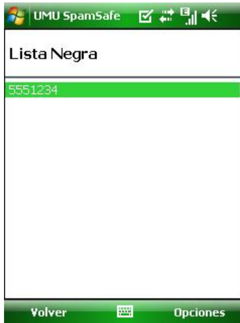
Figure 9 Configuración de la Lista Negra