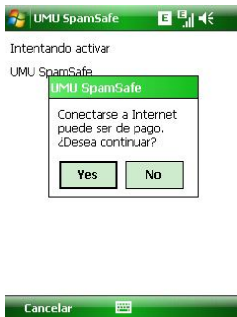
Figure 1 Activación

Si elige "No", la aplicación se cerrará pero continuará instalada en su dispositivo. Si desea continuar, elija "Sí".