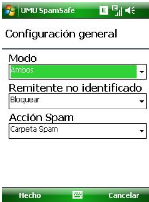
Figure 7 Configuración General

Seleccione el modo que se adapte mejor a sus necesidades.