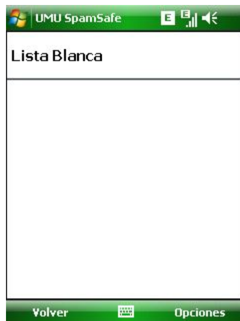
Figure 8 Configuración de la Lista Blanca

La lista blanca determina aquellos números de los cuales los mensajes siempre deben aceptarse. La agenda de su dispositivo se incluye automáticamente en la lista blanca, aunque esta no se muestra.